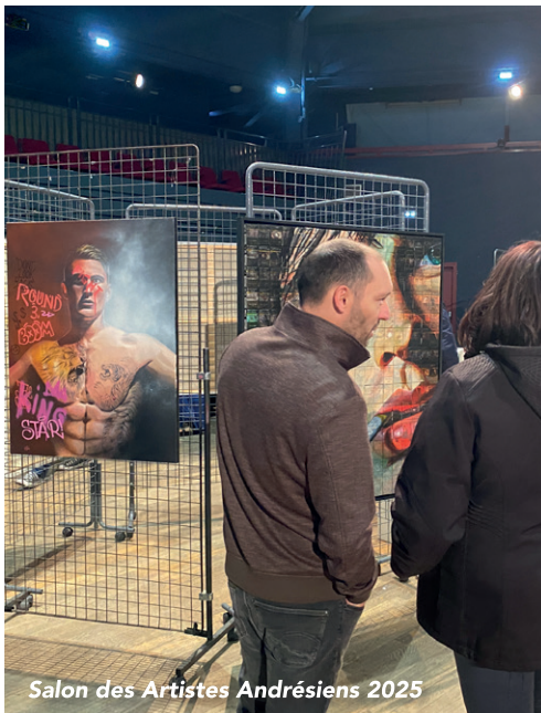
Salon des Artistes Andrésiens 2025